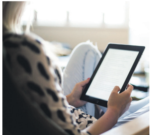
„Legimi” umożliwi czytanie na tablecie

dzie furtka od strony stacji Orlen. Wewnątrz staną 3-4 niskie (20 x 150 x 150 cm) platformy - górki obłożonych żywą trawą, pod którymi królicze norki byłyby niezagrożone. Mają też być inne elementy architektury dla zwierząt, plansze edukacyjne i informacje, czym wolno, a czym nie wolno karmić króliki.