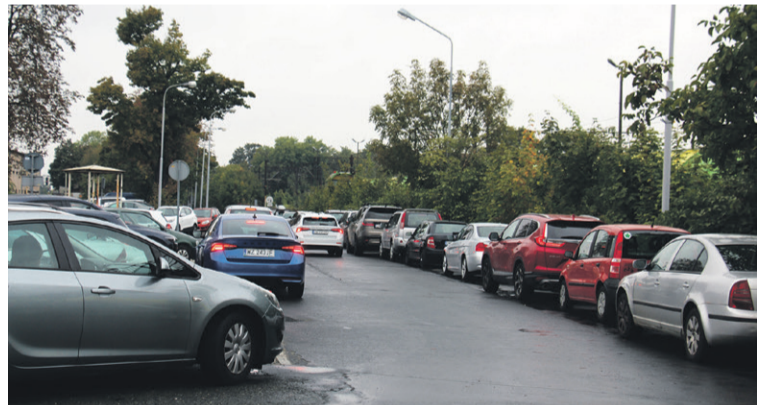
I komu to przeszkadza?