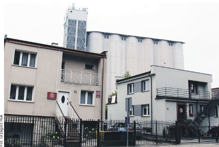
Silosy stoją za blisko domów