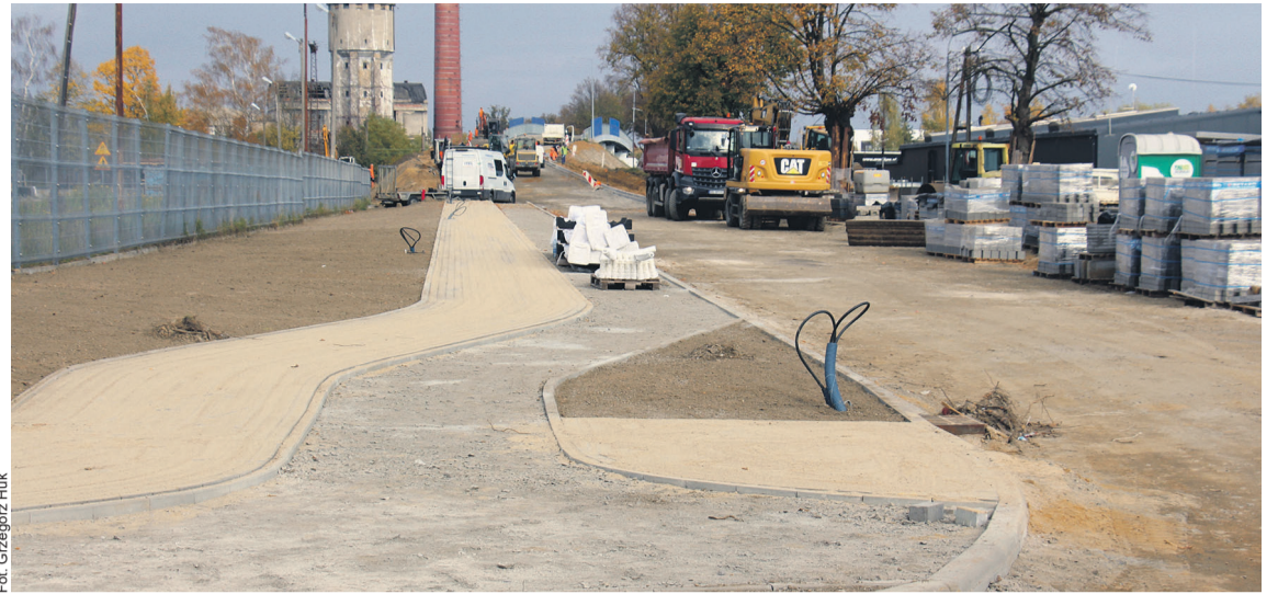
W końcu będzie tu chodnik