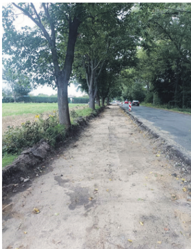
Musiało być tak szeroko?