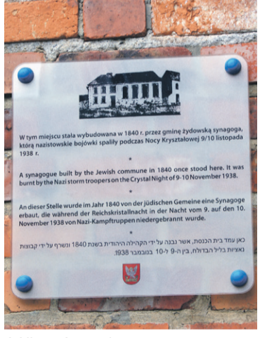
A Niemców tu nie ma...

Na tabliczce informacyjnej (zdjęcie w załączeniu) według mojej, może subiektywnej, opinii jest brak narodowości tychże nazistów. Obcy kulturowo turyści np. z Japonii, Korei, Chin, nie znając historii Europy XX wieku, nie znajdując państwa „nazistowskie”. Winno być dodane „niemieccy naziści”.