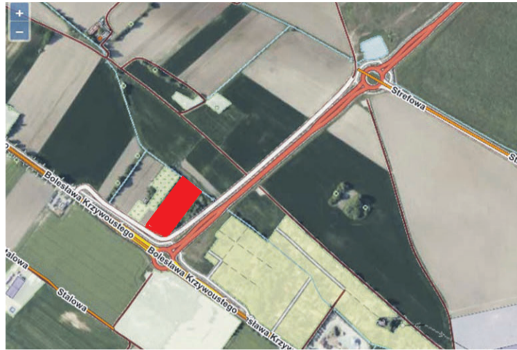
Tu stanie krematorium

Według naszych nieoficjalnych informacji takie przedsięwzięcie to koszt 10 - 12 milionów złotych. Ale na pewno opłacalna, bo trend jest wyraźny - kremacji w Polsce jest coraz więcej. We Wrocławiu są dwa krematoria, inne, najbliższe Oleśnicy mamy w Brzegu. A dalej jest Kalisz i Łódź. - Zainteresowanie kremacjami rośnie. Cztery lata temu było 20 - 25 procent kremacji, a obecnie to 50 procent - mówi