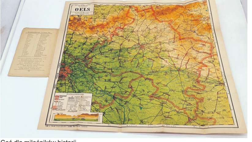
Coś dla miłośników historii