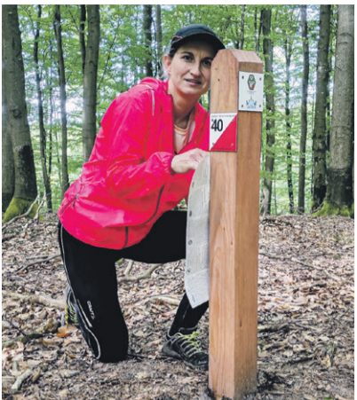
Na słupkach kody QR

Projekt „Króliczy skwer - zadbajmy o oleśnickie króliki” za 80.000 zł dostał głosów 213. Na placu Staszica zostanie wydzielony fragment trawnika pod schronienie dla królików. Miejsce będzie ogrodzone metrowym ozdobnym płotkiem o długości 110 m, obsadzonym roślinnością. Jedynym wejściem bę-