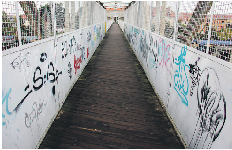
Temat kładki powraca

Co robi PKP? Przypomnijmy, że doprowadzenie do poprzedniego remontu trwało kilka lat. Kolej długo odpowiadała, że kładka nie jest jej potrzebna i najlepiej byłoby, gdyby przejęła ją na własność miasta... (ror)