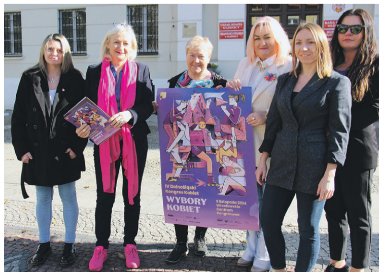
Feministki zapraszają na Kongres Kobiet

- Zapraszamy na cały dzień paneli, dyskusji, imprez towarzyszących i koncertów. Stworzyliśmy bogaty program i przestrzeń, podczas której kobiety będą mogły dyskutować o najważniejszych sprawach. Hasło kongresu „Wybo-