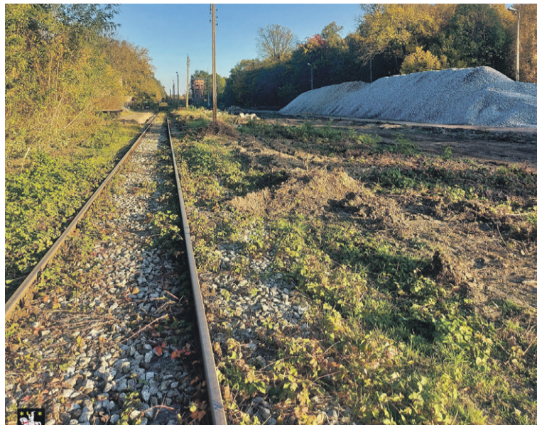
Kiedy pojedzie tu pociąg?