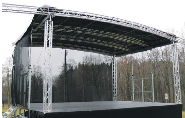
Będzie scena z wyposażeniem za 145 tysięcy

2.189 osób zdecydowało o rozdzieleniu miliona złotych w Oleśnickim Budżecie Obywatelskim w roku 2025.