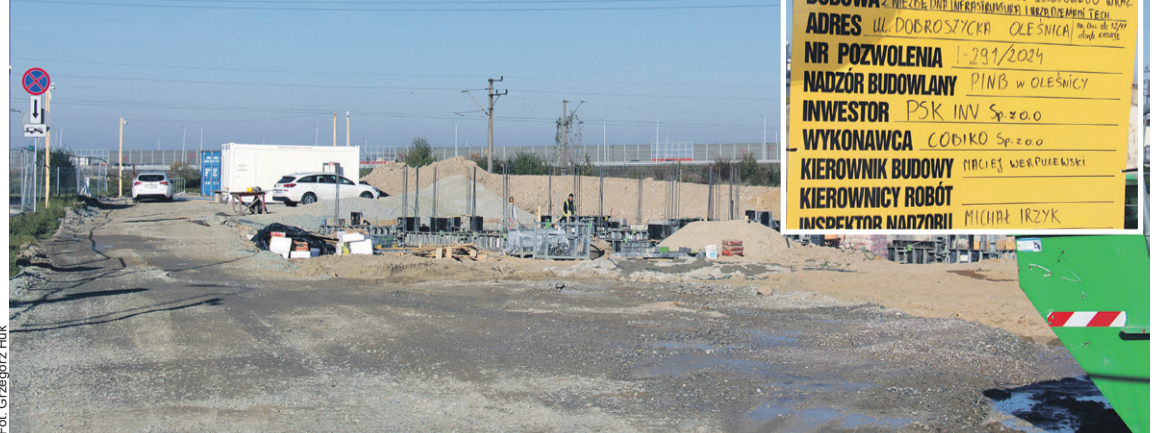
Do kwietnia ma być gotowe

A kiedy zjemy tu pierwszą kanapkę z kurczakiem?