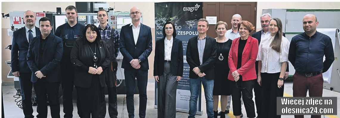
Wiecej zdjęć na olesnica24.com

Otwierają się dla szkoły nowe możliwości