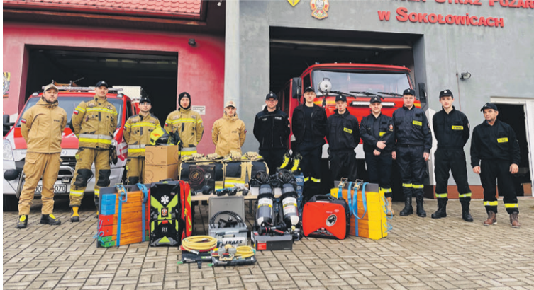
Dzięki „Bitwie o remizy” gminne OSP wzbogaciły się o nowy sprzęt

Dzięki wyborczej frekwencji pieniądze trafiły do OSP. A samorząd pozyskał środki na inwestycje i cyberbezpieczeństwo.