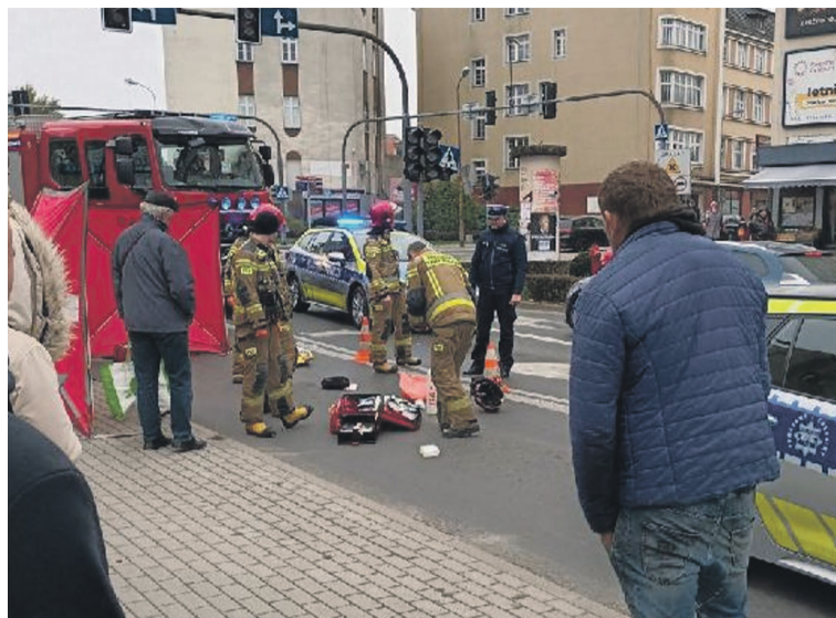
Nie ma sądowego finału tej tragedii

Prokuratura wciąż analizuje sprawę wypadku, w którym zginęła emerytowana nauczycielka geografii.