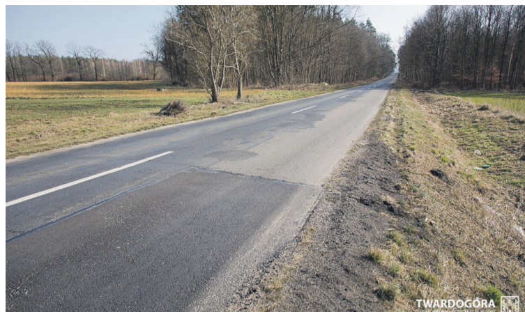
Tu pojedziemy rowerem 1 lipca 2026 roku

Nawierzchnia ścieżki wykonana zostanie z asfaltu i będzie miała szerokość 2,5-3,0 m. Biec będzie po istniejącym terenie przez teren zabudowany i niezabudowany. Wybudowana zostanie po prawej stronie drogi wojewódzkiej nr 439 częściowo przy krawędzi drogi, a częściowo za istniejącym rowem drogowym. Budowana trasa to w części będą odcinki przeznaczone wyłącznie dla rowerów, w części dla pieszych i rowerów. Powstanie także wiata przystankowa z ławką i koszem na śmieci, a także oznakowanie trasy znakami poziomymi