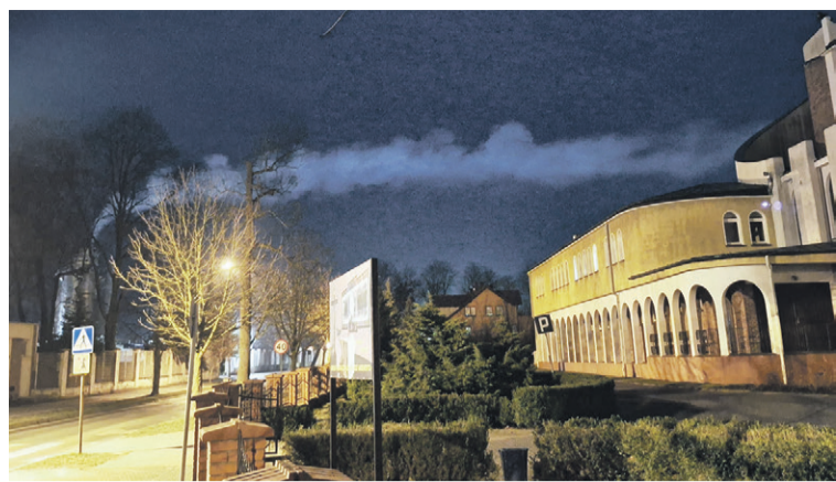
Ten dym jest eko?

Może taki ma być, ale warto, aby samorząd znów przyjrzał się procesowi spalania odpadów w firmie.