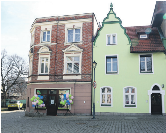
Twardogórski Pałac Kultury

TWARDOGÓRA • Gmina otworzyła w końcu swój ośrodek kultury. Nie miała go jako jedyna gmina w powiecie.