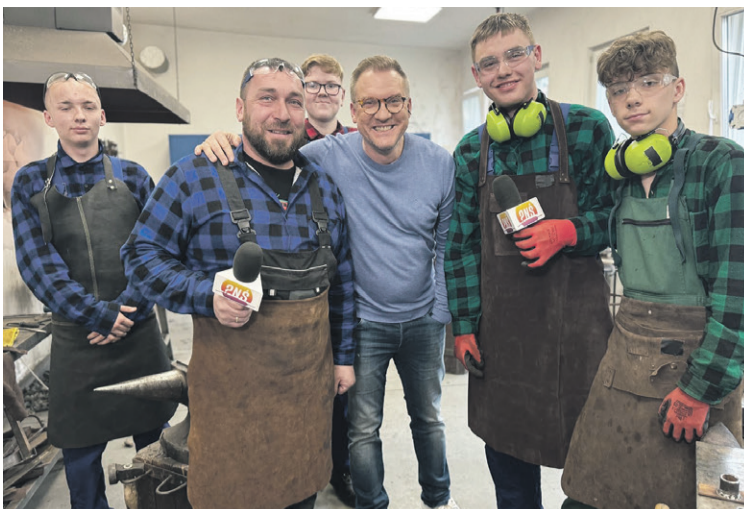
Nauka kowalstwa - tylko w Oleśnicy