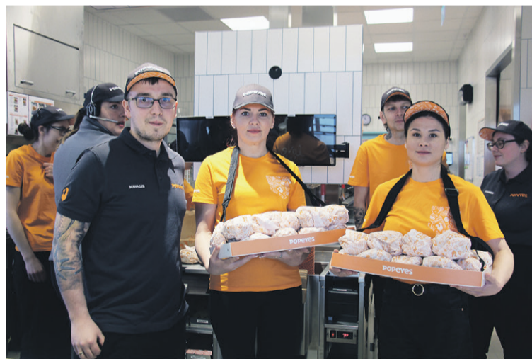
Załoga jest gotowa!