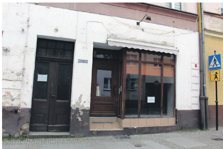
Tu były najlepsze, bo jedyne w mieście, lody