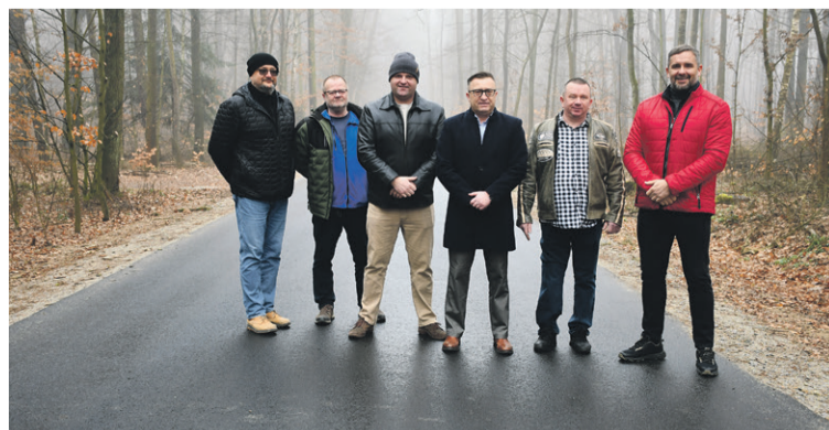
W Osadzie Leśnej mają już nową drogę

Wykonawcą jest Tom Trans Tomasz Walczak, a koszt inwestycji to 3.390.000 zł.