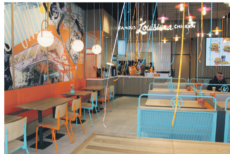
Tak wygląda w środku

kontakt z mediami z ramienia Popeyes Kamila Więcka . - Wszystkich chętnych zapraszamy w godzinach 8-24 przez siedem dni w tygodniu - dodaje.