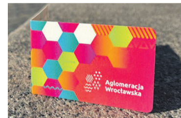
Korzystaj z promocji!

Dzięki Karcie Aglomeracyjnej zyskujemy dostęp do różnych ofert i promocji u partnerów programu. Oferta obejmuje 19 obiektów: Aquapark Wrocław, ZOO, Hydropolis, Centrum Historii Zajezdnia, Muzeum Śląska Wrocław oraz zwiedzanie stadionu, mecz WKS, Średzki Park Wodny, Krośnicka Przystań, Brzeskie Centrum Kultury, aquapark Brzeg, Aquapark Granit Strzelin, ścianka wspinaczkowa, siłownia i fitness MOSiR Sy-