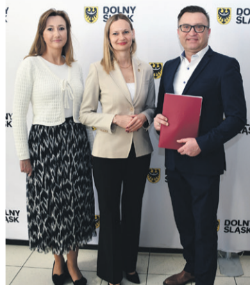
Na kanalizację pozyskano 3,2 mln zł

Zamówienie zostało dofinansowane z Rządowego Funduszu Polski Ład kwotą 2.000.000 zł, a gmina Oleśnica wraz z powiatem oleśnickim dołożyły po 695.000 zł. Termin realizacji I etapu – czerwiec 2025 roku.