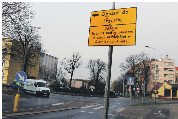
Drogowcy się szykują...

Miasto pozyskało na inwestycję 4.789.017 zł z Programu Fundusze