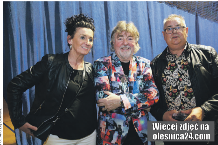
Zdjęcie z artystą obowiązkowe

Podczas koncertu artysta nie tylko wykonywał swoje największe przeboje, ale również dzielił się ze słuchaczami historiami i anegdotami, które wprowadzały w klimat każdej kolejnej piosenki. Publiczność usłyszała m.in kompozycje: