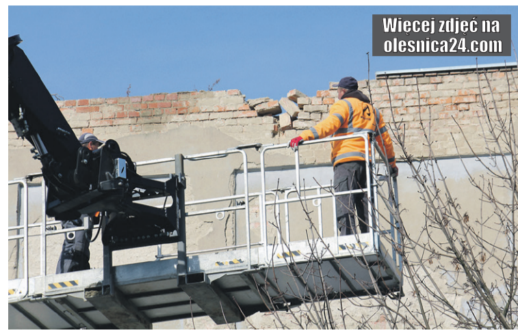
Wiecej zdjęć na olesnica24.com

- Obecnie jestem na etapie zlecenia specjalistom z Politechniki Wrocławskiej rzetelnej analizy budowlanej całości. To potrwa kilka miesięcy.