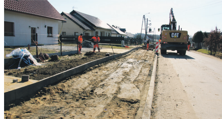
Trwają prace przy budowie ciągu pieszo-rowerowego w Sokołowicach

Od wielu lat samorządy przechodzą proces cyfrowej transformacji, która ma na celu optymalizację i poprawę efektywności realizowanych zadań, ale przede wszystkim poprawę dostępności i jakości obsługi mieszkańców. Proces cyfryzacji, o ile otwiera nowe nieograniczone możliwości, niesie ze sobą także realne ryzyko, które należy minimalizować lub neutralizować poprzez podnoszenie świadomości użytkowników oraz stosowanie wielopoziomych zabezpieczeń. Obecnie, zwłaszcza w okresie trwającej wojny za naszymi wschodnimi granicami, jesteśmy coraz częściej narażeni na cyberataki, które przyjmują coraz bardziej zawaolowaną formę.