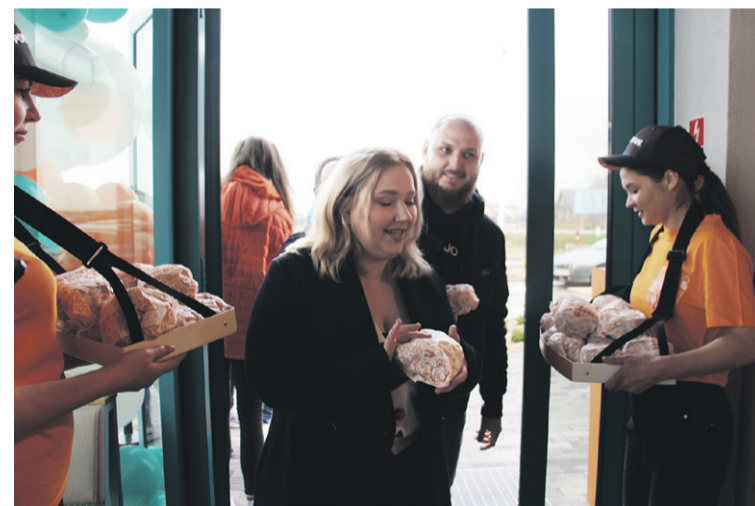
Dla pierwszych kanapka gratis