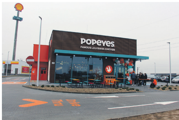
Wybudowany w niecałe cztery miesiące

- Jest to pierwszy nasz lokal w regionie i trzeci w Polsce z dedykowanym dla kierowców stanowiskiem drive thru. Ma to związek z lokalizacją restauracji przy dużym węźle drogowym. W lokalu zatrudnionych jest 30 młodych ludzi z Oleśnicy i okolic, którzy niedawno przeszli szkolenie we wrocławskiej restauracji w Pasażu Grunwaldzkim - mówi Panoramie odpowiedzialna za