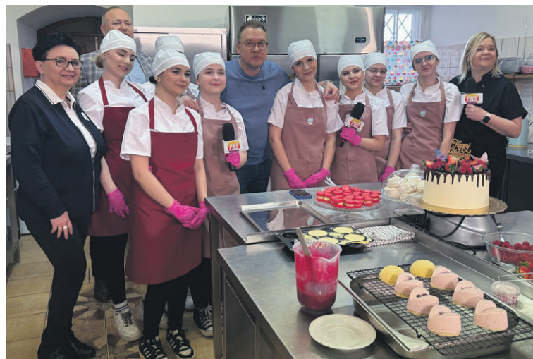
Menu a'la CKiW OHP