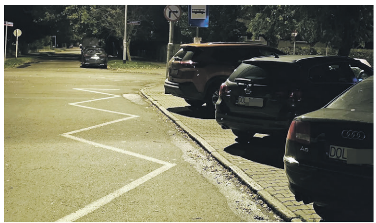
Co sygnalizuje znak poziomy? Niestety chyba nie wiedzą...