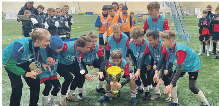
Gotowi na mecz!

Zawodnicy Akademii Piłkarskiej Oleśnica wygrali wojewódzki finał turnieju „Z orlika na stadion”.