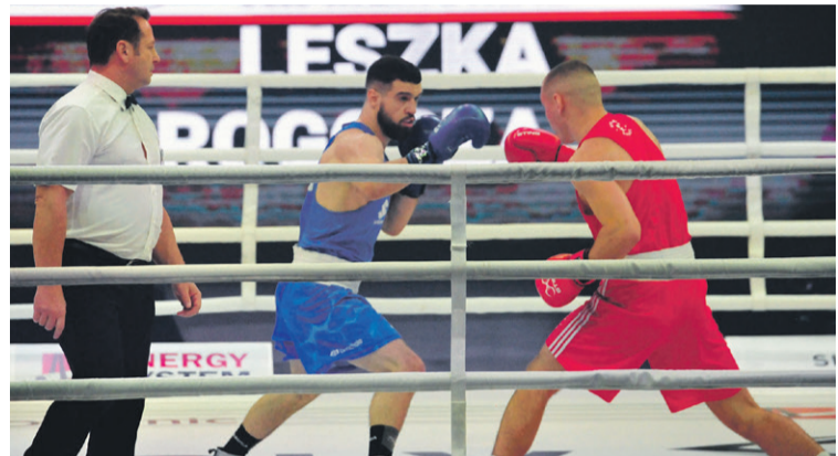
Odbył się mecz Polska - Węgry

Srebrna medalistka olimpijska była gościem na turnieju bokserskim w Oleśnicy.