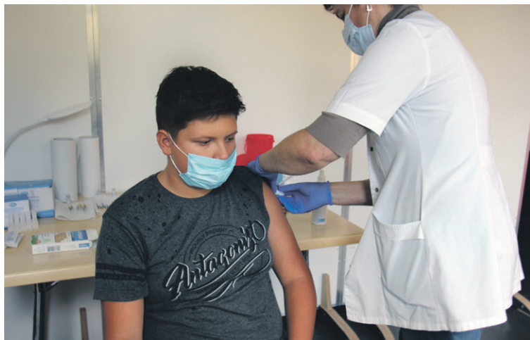
Dla niektórych jest to problemem

- Na terenie naszego powiatu w ostatnich latach nie doszło do karania w sądzie czy przez sanepid mandatem karnym rodziców, którzy uchylili się od tego obowiązku. Ta kwestia jest prawnie w Polsce nie do końca, niestety, uregulowana. Stąd jest problem ogólnokrajowy - mówi dyrektorka PSSE. - My wzywamy rodziców, zapraszamy ich do nas na rozmowę. Ma ona charakter informacyjno-edukacyjny - zachęcamy rodziców, aby ponownie przeanalizowali, zastanowili się. Czasami dzieci