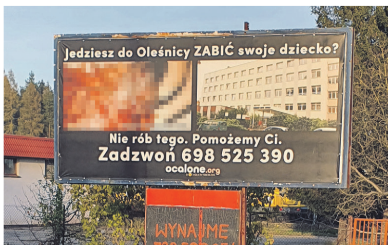
Bilbord może szokować

- Jako mieszkaniec Oleśnicy nie mogę zaakceptować przekazu tego hasła - mówi radny.