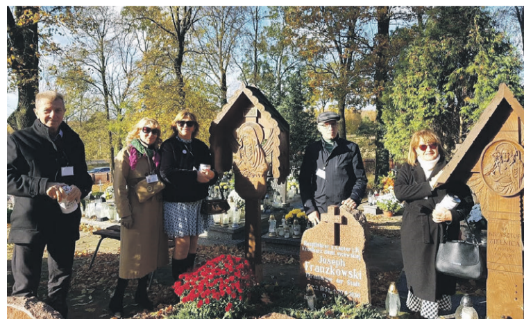
Uczestniczą w tej akcji rokrocznie