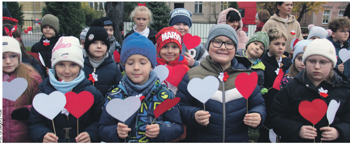
Było patriotycznie i kolorowo

W uroczystości niepodległościowe zaangażowała się cała szkolna społeczność.