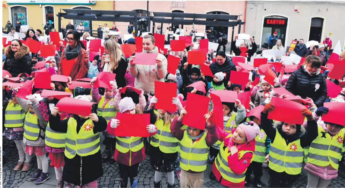
Ułożyli biało-czerwoną flagę