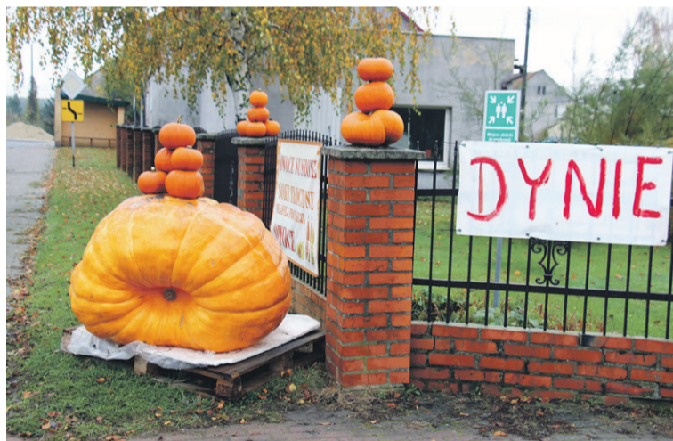
To nie atrapa, to dynia gigant!