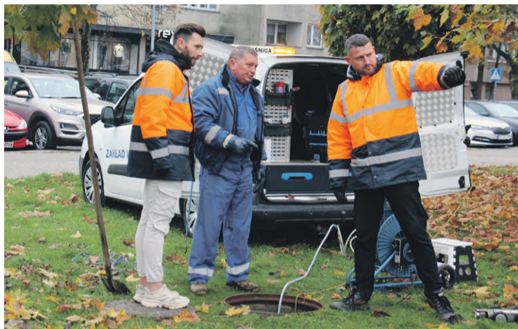
Kamera inspekcyjna rozwiązała hydrozagadkę

Miejmy nadzieję, że kłopot mieszkańców został rozwiązany, a piwnice zostaną gruntownie zdezynfekowane. (hag)