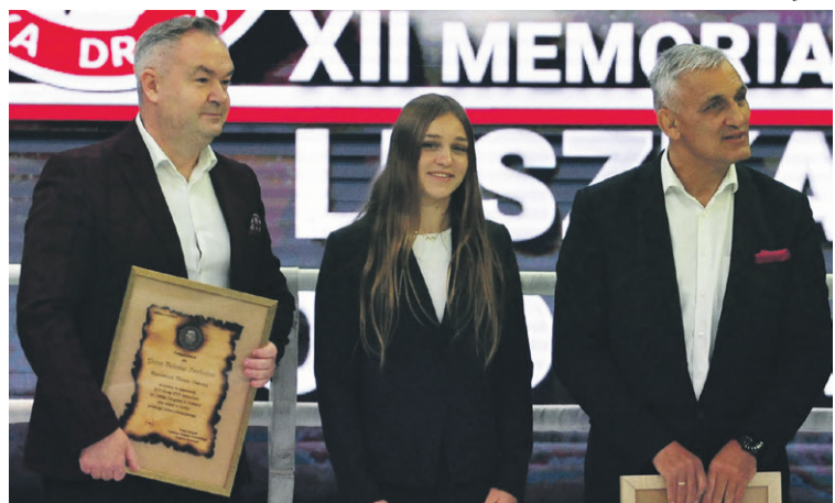
Specjalny gość ozdoba gali