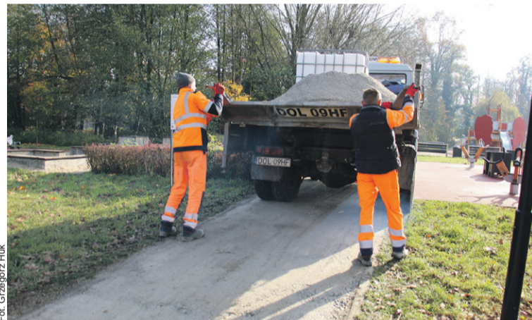
Dla komfortu pieszych i rowerzystów

Uzupełniane są ubytki, poprawiane krawężniki, a całość utwardzana i wyrównywana.