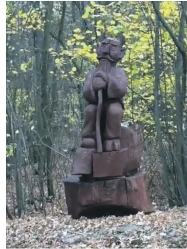
Jak go nazwiecie?

A przy Diabelskim Kamieniu stanęła rzeźba czarta, stojąca do tychczas przy MGOK. - Wiąże się to z legendą o tym miejscu - mówi tajemniczo przez „Zbójnika”. A jak zostanie ów czart nazwany? Belzebub, Leśny Czart, Łomek, Rzutek, Kamyk - proponują mieszkańcy.