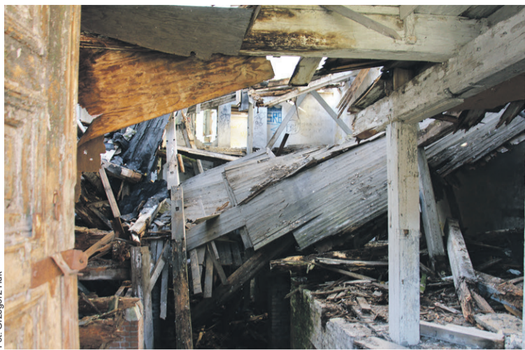
Taki okropny widok

„W młynie runął strop. Precyzyjniej, jego część. Obiekt dawnego młyna dzisiaj przypomina studnię. Czy nie stwarza zagrożenia?” - napisaliśmy przed dwoma miesiącami, przypominając szeroko historię młyna na ulicy Młynarskiej. Na naszych łamach Krzysztof Prusiewicz, kierujący Powiatowym Inspektoratem Nadzoru Budowlanego, powiedział, że wydał decyzję o zabezpieczeniu obiektu i częściowych rozbiórkach uszkodzonych elementów. Dodał, że jest w kontakcie z prywatnym właścicielem obiektu, który deklarował, że usunie rażące zagrożenia i zabezpieczy budynek. Prace może wykonać po uzyskaniu zgody i pod nadzorem wojewódzkiego konserwatora zabytków.