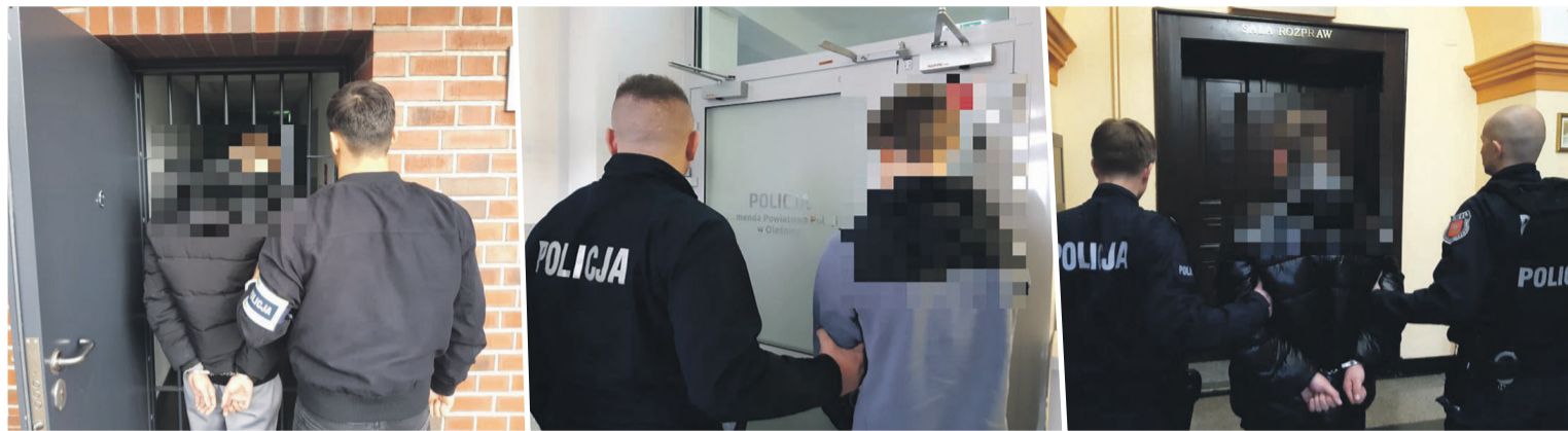
18-latek i dwóch nieletnich - jak mogli wpaść na taki pomysł...

Śledztwo trafiło w ręce policjantów specjalizujących się w przestępczości przeciwko życiu