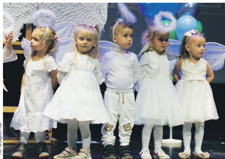
Nad wszystkim czuwały aniołki

Grali, śpiewali, kwestowali na rzecz powdzian.