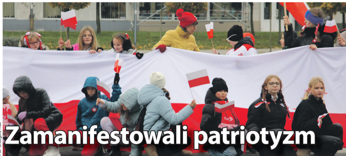
Na placu Zwycięstwa zrobiło się biało-czerwono

niej, a ich kulminacją był uroczysty apel o symbolicznej godzinie 11.11 w miniony piątek. Wśród zaproszonych gości znaleźli się m.in. przedstawiciele służb mundurowych oraz organizacji kombatanckich. Pojawił się nawet sam Józef Piłsudski, który wygłosił do uczniów patriotyczny manifest. Uzupełnieniem świątecznego eventu był szkolny kiermasz, podczas którego można było zakupić wykonane przez dzieci i ich opiekunów łakocie udekorowane w narodowe barwy, a także wystawa „Ojcowie Niepodległości”. (hag)