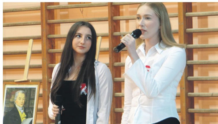
Przygotowano piękną część artystyczną

Podczas późniejszej części artystycznej apelu, oprócz recytacji wierszy i śpiewania pieśni, uczniowie również przedstawili dokładnej sylwetki wspomnianych wcześniej