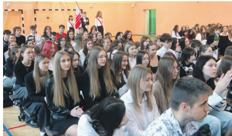
Uczniowie słuchali w skupieniu

Podczas późniejszej części artystycznej apelu, oprócz recytacji wierszy i śpiewania pieśni, uczniowie również przedstawili dokładnej sylwetki wspomnianych wcześniej