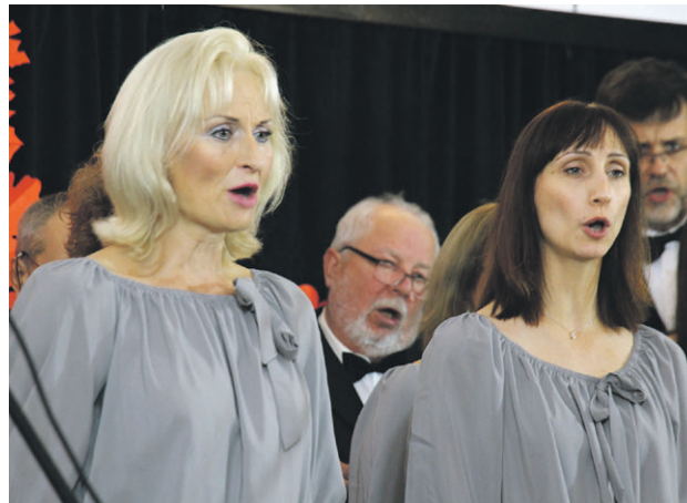
Chór Appassionata dał popis wokalnego kunsztu