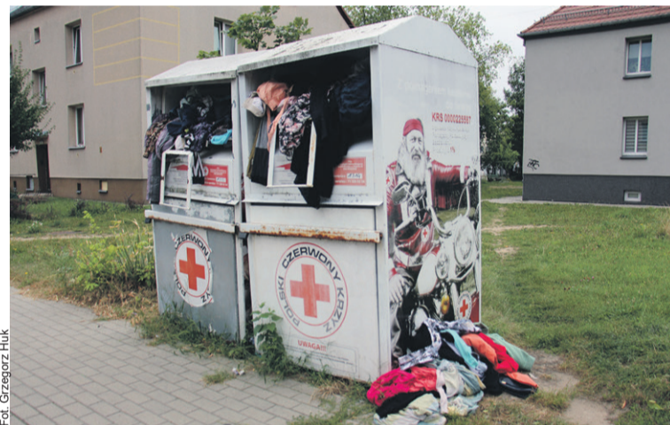
Odzież z reguły się nie mieści

- Musimy się z tym zmierzyć, żeby sytuację poprawić - deklaruje przewodniczący Rady Miasta.