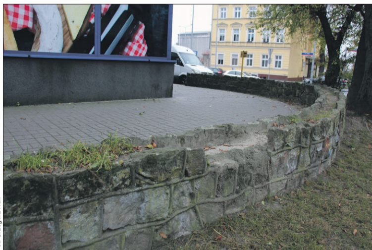
Nic tylko rozebrać!..

Radny PiS powiedział, że „w miejscu tym zamieszkują osoby starsze, schorowane, dla których spokój i cisza są priorytetem” Przypomniał, że kilka lat temu przy okazji budowy zatoczek parkingowych wzdłuż ulicy zlikwidowano murki na wysokości wszystkich pozostałych bram,