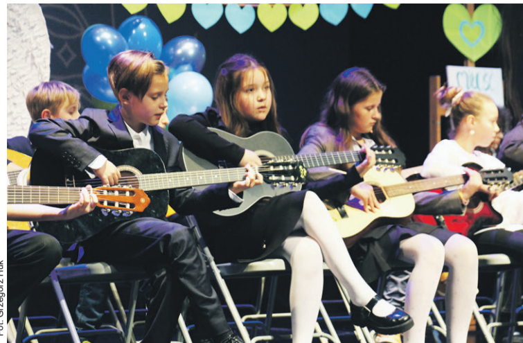
Gitarzyści dali krótki popis