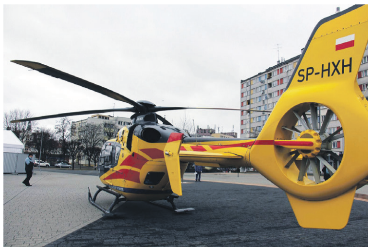
Taki widok jest coraz częstszy

Radny opozycji rzuca taki pomysł. Radni rządzącego klubu są sceptyczni.