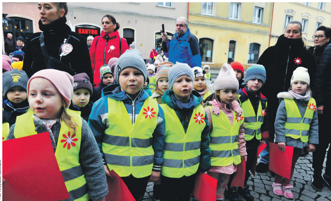
Oni znają słowa „Mazurka Dąbrowskiego”

Przedszkole nr 1 zaprosiło do wspólnej akcji z okazji Święta Niepodległości.