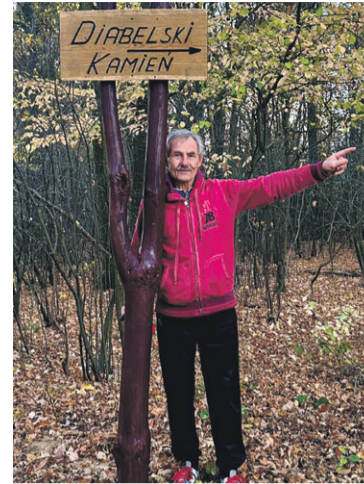
O, tam szukajcie skarbu...