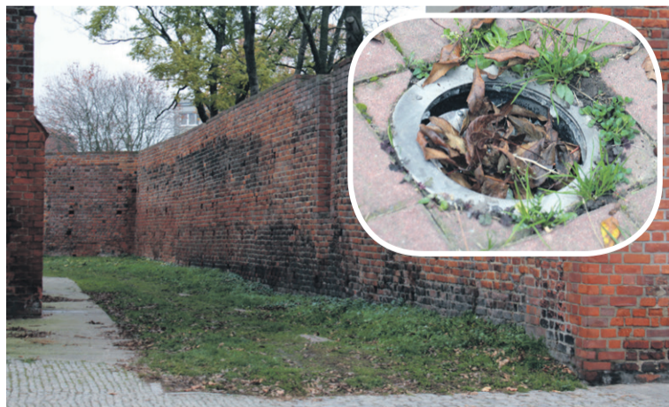
To jest prawdziwa oświetleniowa demolka