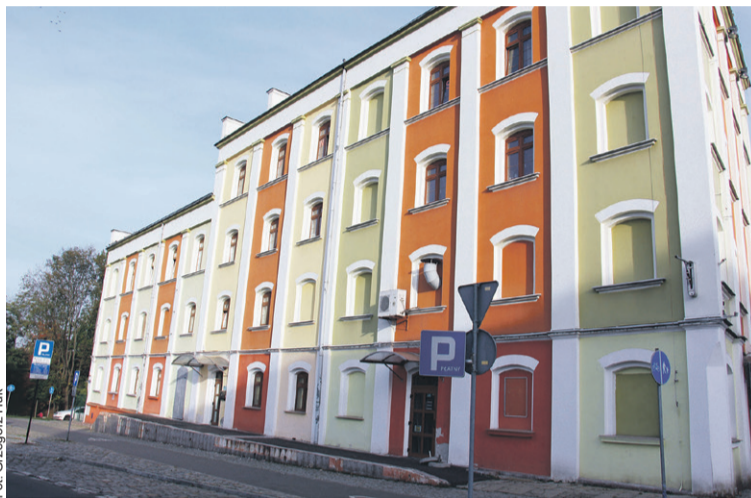
A tu na razie mieszkań nie będzie