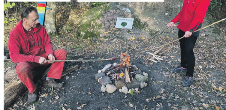
Jest miejsce na przyjemną rekreację

- Zbójnicy zapraszają na Diabelski Kamień, bo ukryte tam legendarne skarby nadal czekają