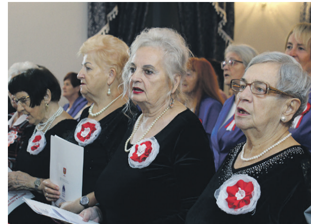
Śpiewający seniorzy jak zawsze w dobrej formie