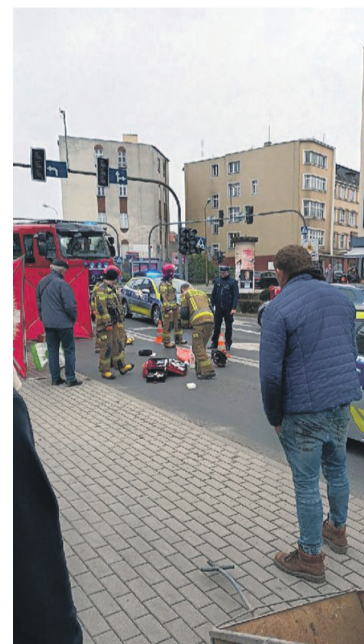
Sygnalizacja nie działa i jest dramat

Kto przyczynił się do wypadku? Policja przez kilka godzin na miejscu zbierała materiały i dowody. Wśród świadków krążyły dwie wersje - jedna, że seniorka została potrącona na pasach, druga, że przechodziła przez jezdnię około 10 metrów od przejścia dla pieszych. Pewne jest to, że na skrzyżowaniu od dwóch dni nie