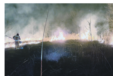
Kolejne identyczne zdarzenie w krótkim odstępie czasu.

„5 marca o godz. 19:27 podczas powrotu z pożaru nieużytków Państwowa Straż Pożarna w Oleśnicy zadysponowała Ochotniczą Strażą Pożarną w Twardogórze do pożaru suchej trawy i krzewów w miejscowości Grabowno Wielkie”