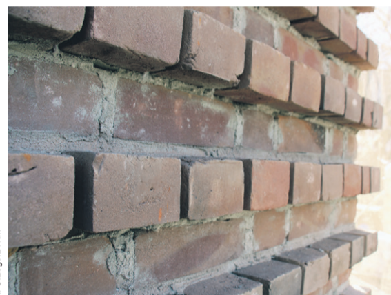
Strzypia - nie mylić z przyporami - to fragmenty ściany, które służą do połączenia z kolejną ścianą

Wybudujemy wieżę - wierzę, wierzę, wierzę... - to słowa niezapomnianego pacyfistycznego songu z musicalu Metro . W Bierutowie wieża już stała, ale efekt jej metamorfozy jest taki, że wygląda, jakby budowano ją od nowa.