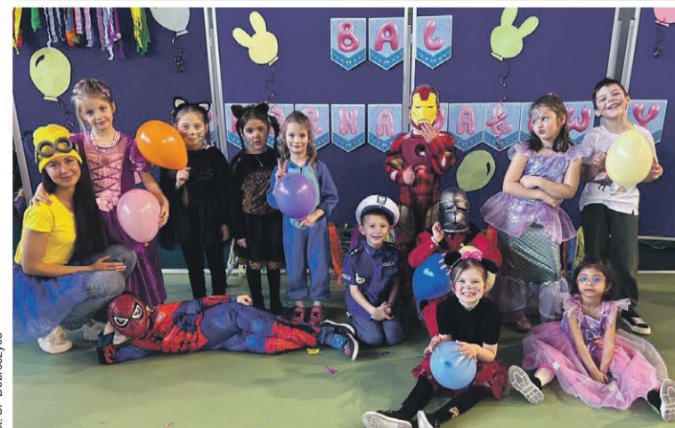
Że też tylko raz w roku obowiązuje w szkole taki strój...