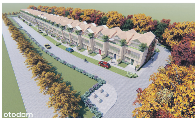
Kto wejdzie w ten biznes?