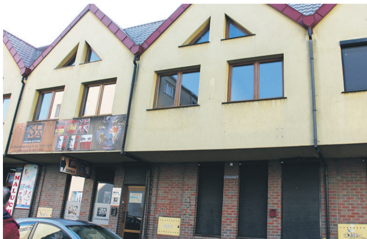
Mieszkanie i biznes w jednym...