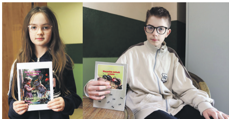
To są dzieci z pasją