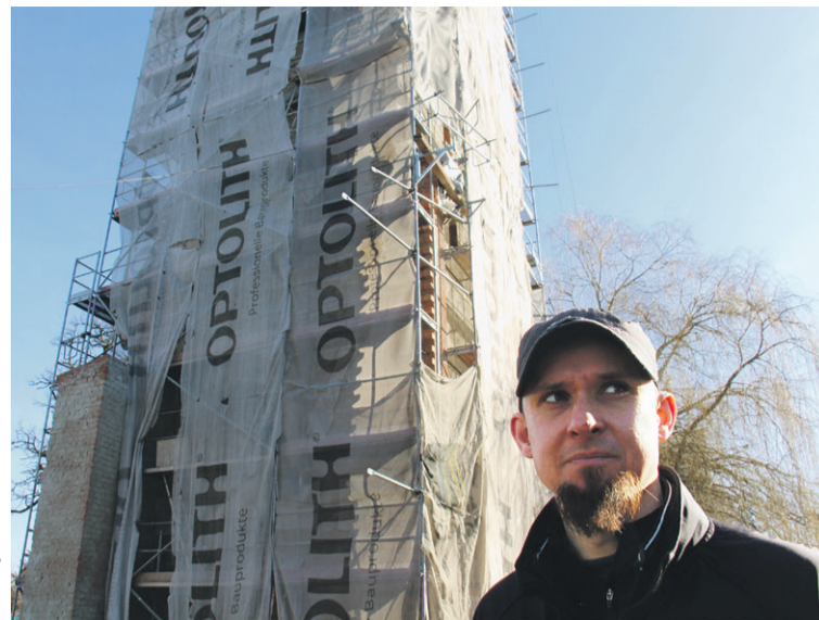
Poprowadził nas kierownik budowy