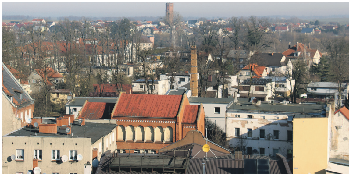
Takie widoki tylko z wieży

BIERUTÓW. Byliśmy w i na bierutowskiej wieży.