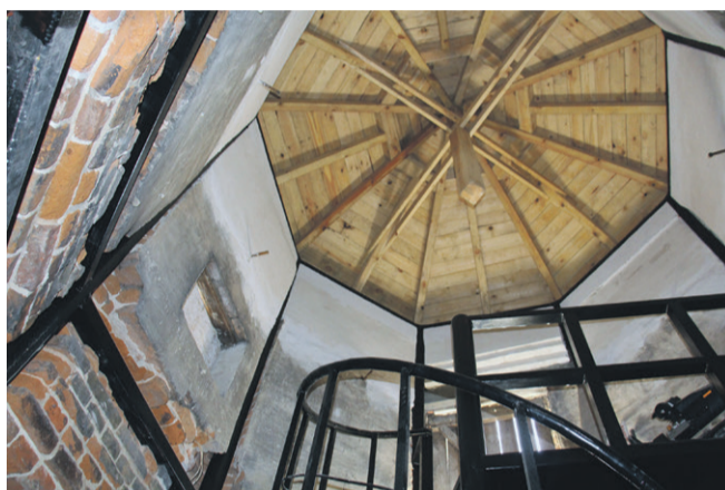
Widać drewniane sklepienie