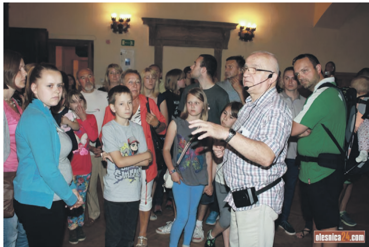
Przyjeżdżały tłumy z Wrocławia