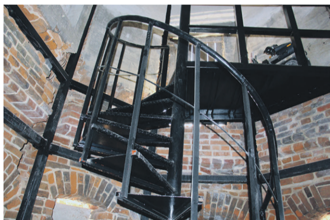
Jak na latarnię morską