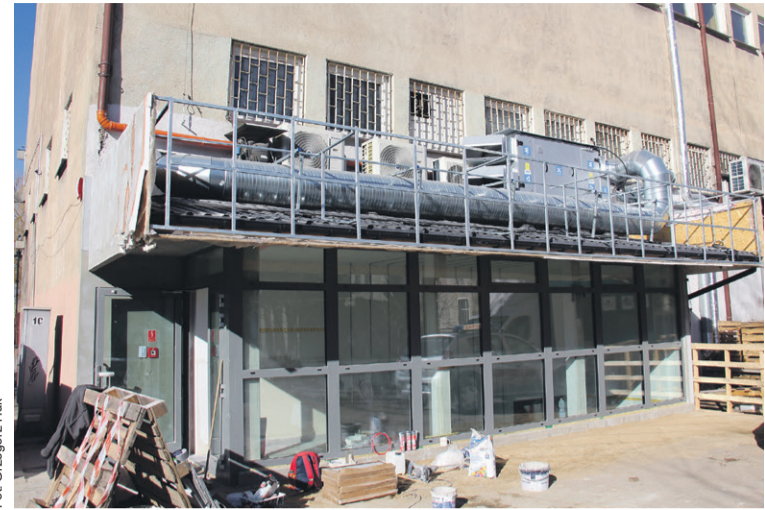
Wejście jest na tyłach obiektu