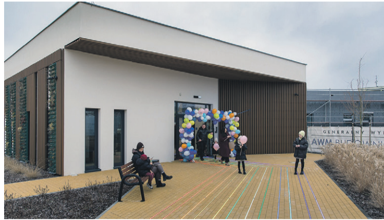
Jest powód do radości

Krystian Ulbin mówił też, że do żłobka mogą być przyjmowane dzieci od 20. tygodnia (można wprowadzić wyższą barierę wiekową np. 11. miesiąc), a w klubie dziecięcym od roku (nie wolno szybciej przyjmować dzieci w klubie). - W Sycowie dzieci przyjmowane są po skończeniu 1. roku życia, dlatego że do