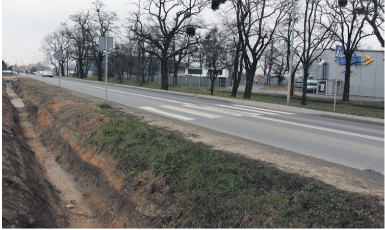
Piesi maszerują do rowu!