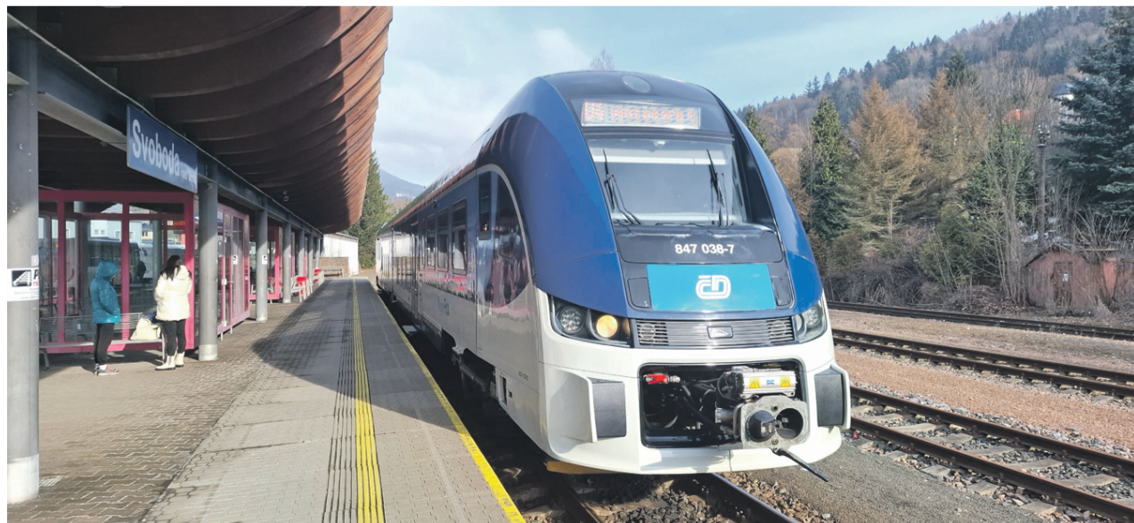
Takie pociągi PESA jeżdżą już u naszych czeskich sąsiadów