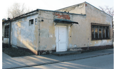
Nadchodzi jego kres