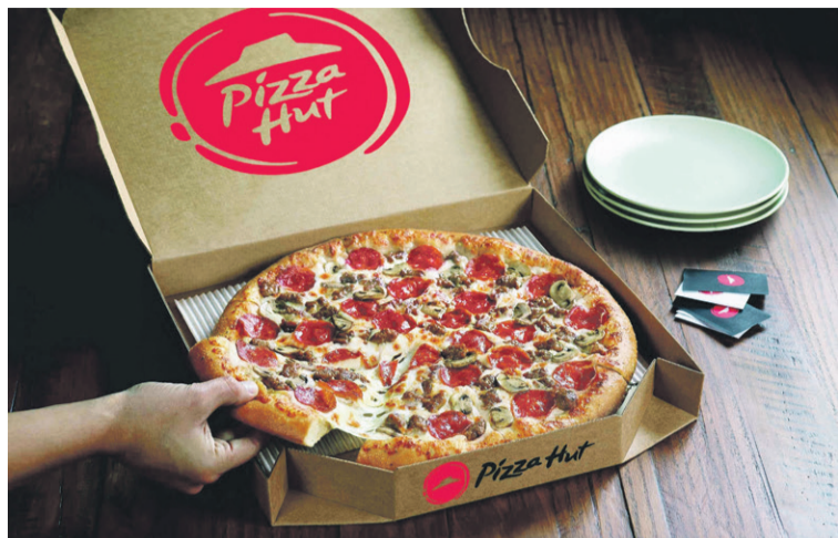
Zjemy ją w Oleśnicy

A w zasadzie na jego obrzeża. Ale na pewno będzie to gastronomiczny hit.