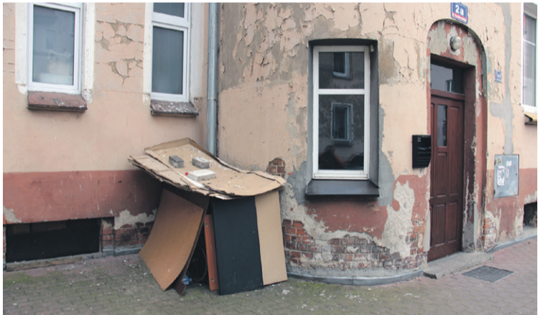
„Altanka” na znaleziska