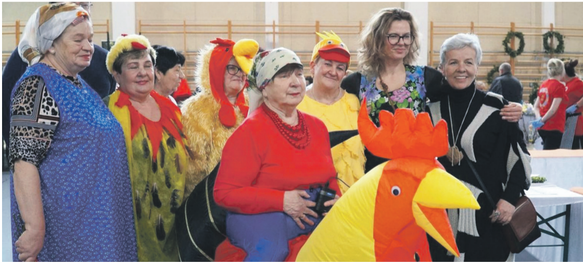
„Kogutek” to jedna z wizytówek GOK

GMINA OLEŚNICA • Z czego? Z tworzenia gminnej kultury - spuentowała swoje wystąpienie dyrektor GOK-u.