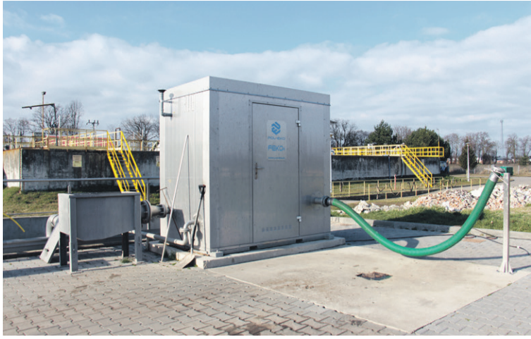
W oczyszczalni pojawiły się nowoczesne urządzenia

BIERUTÓW • Sieć wodociągowa w 80 proc. jest stara i wymaga wymiany. Stare są też budynki, często zdewastowane.