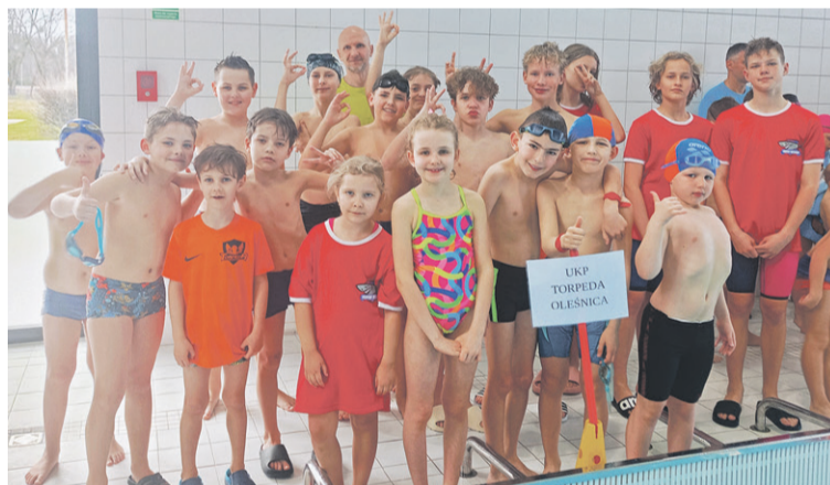
Razem zdobyli 18 medali

Z dorobkiem 18 medali wrócili z zawodów w Miliczu pływacy Torpedy Oleśnica.