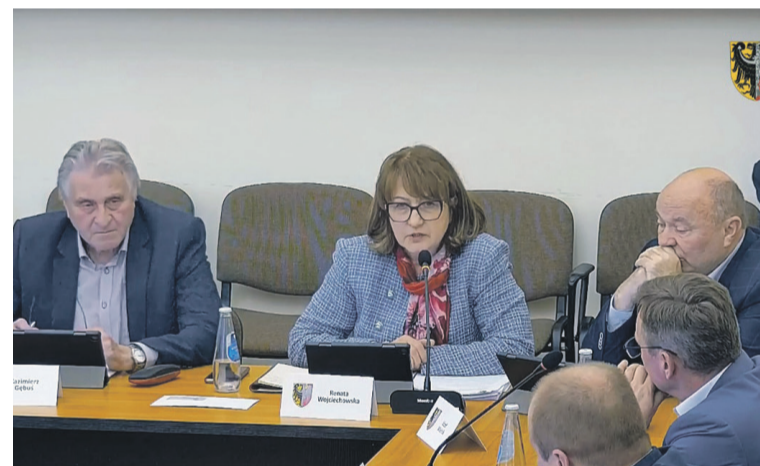
Radna zapytała o imigrantów

Po czym w swoim stylu podgrzał dyskusję: „Natomiast obito mi się o uszy, że jakiś czas temu faktycznie do Polski napłynęła duża liczba migrantów nielegalnych z krajów bym powiedział daleko od nas. To jeszcze było za czasów poprzedniego rządu, ale to polecam pani radnej odszukać