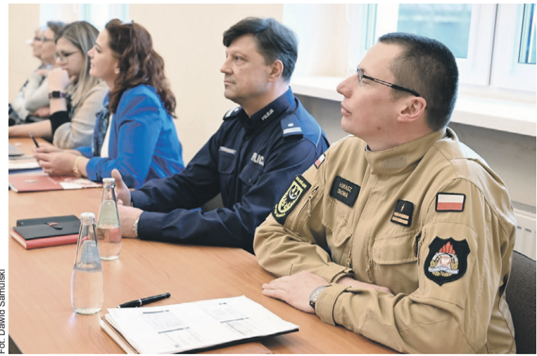
Szefowie służb zdali sprawozdanie

Komendant policji pochwalił się m.in. zatrzymaniem czterech osób podejrzanych o oszustwa metodą na Blika, dilerów odpowiedzialnych za posiadanie ponad 30 kg narkotyków, 36-latką, który dokonał kradzieży wyrobów jubilerskich o łącznej wartości 33 tysięcy złotych, czy sześciu obywateli Gruzji, którzy na terenie województwa dolnośląskiego dokonali kilku włamań do domów i mieszkań. Przypomniał, że funkcjonariusze Wydziału Kryminalnego ustalili, a następnie dokonali zatrzymania sprawcy śmiertelnego potrącenia obywatela Ukrainy. 48-letni kierowca tira potrącił pieszego, po czym, nie udzielając mu pomocy, oddalił się z miejsca. Mówił także o tym, że wandal-graficiarz został zatrzymany przez dzielnicowych z Międzyborza. Był nim 17-latek, który „uczył” swoich nieletnich